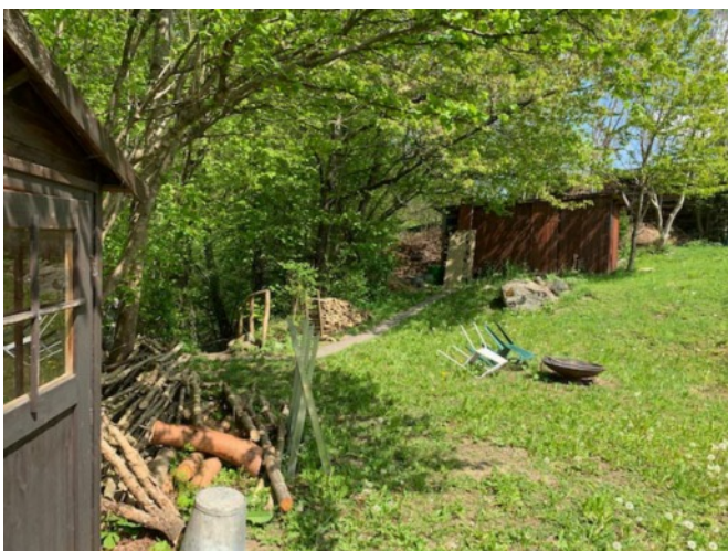
Der Holzplatz mit Grill auf der Obstwiese