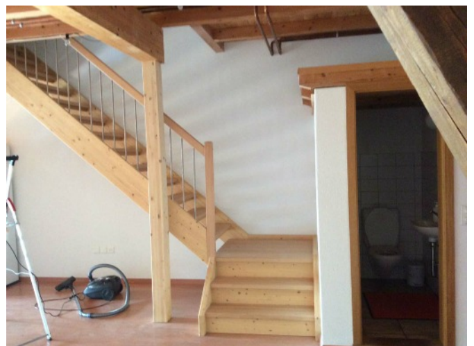
Die Treppe in den oberen Stock und Garderoben WC