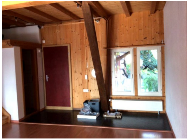
Grosser Wohnraum, 60m2, mit Küche. Balkon mit Abendsonne. Garderoben-WC